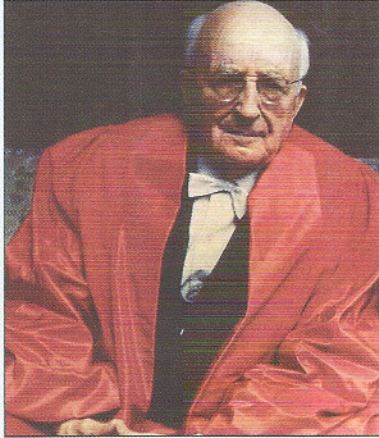
Salvador de Madariaga.

En van intenta vostede presentar España ao estranxeiro como unha democracia. Non hai democracia que valla. Non hai argucia que tape as camisas de cor, como Hitler, as chaquetas claras, como Hitler, os pantalóns escuros, como Hitler, o saúdo romano, como Hitler, o título de Caudillo, mala tradución de Führer, como Hitler, o partido único comendado o país en plena esmorga de corrupción, como Hitler, a prensa domesticada, como Hitler, os campos de concentración, como Hitler. Xeneral, márchese vostede.